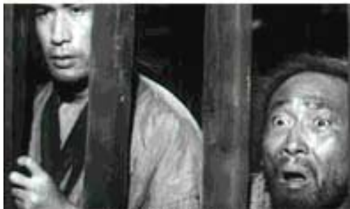
Three Outlaw Samurai

I tre contadini Jinbei , Gosaku e Yohachi , si sono barricati in un vecchio mulino, ai margini del villaggio dove tengono imprigionata Aya , la figlia dell'amministratore Shogunale Matsushita , per convincerlo a ridurre le tasse, che stanno portando alla fame e alla disperazione intere famiglie.